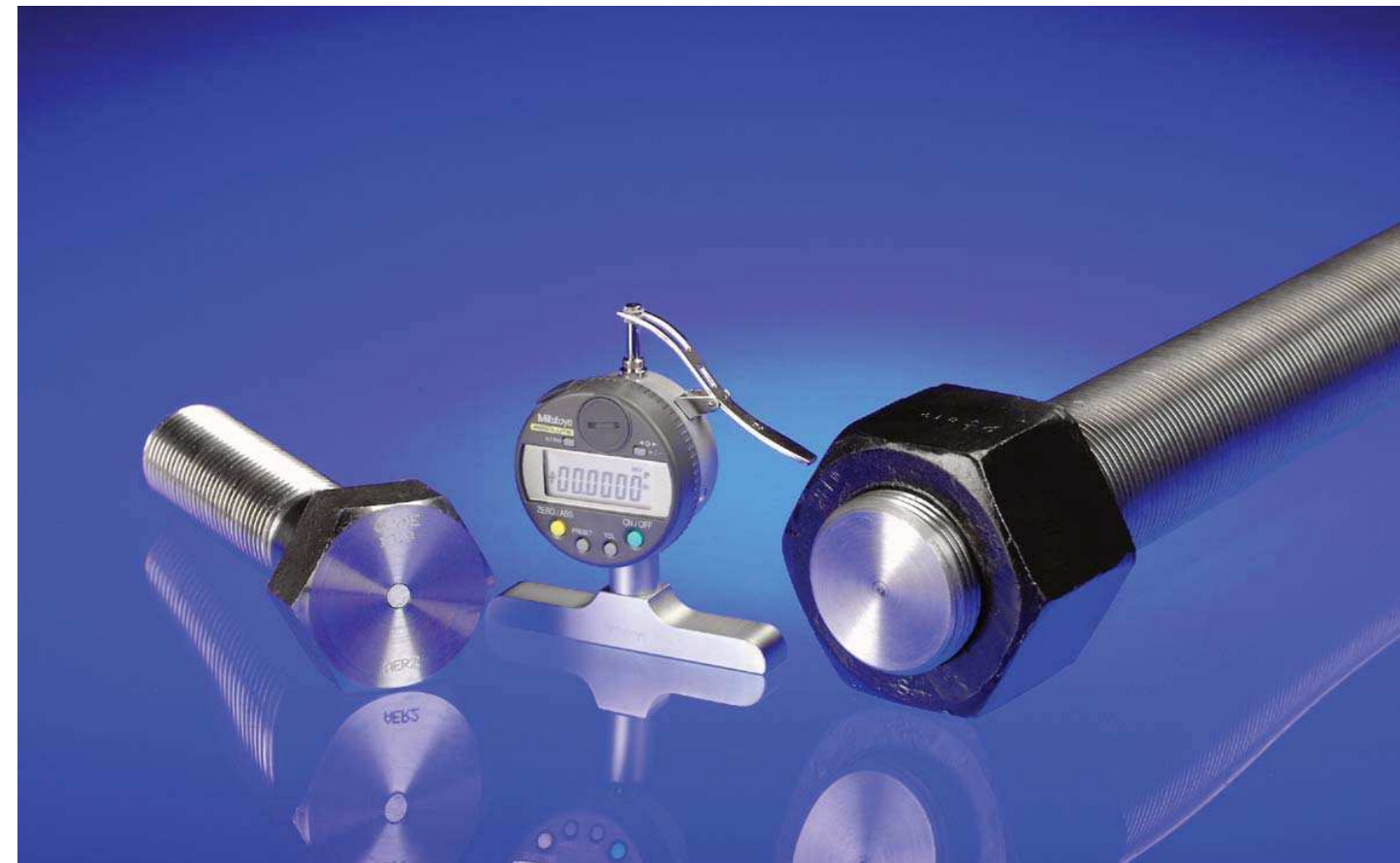
RotaBolt's Indicating Rod Bolt (Anzeige-Stangenschraube)

Das Unternehmen hat seine Technologie auf die Herstellung von Schrauben angewandt, die – individuell – 100% durch Belastungsprüfung kalibriert werden und mit einem speziellen Anzeiger zur Dehnungsmessung ausgerüstet sind. Die Dehnungsmessung jeder Schraube wird individuell zertifiziert.